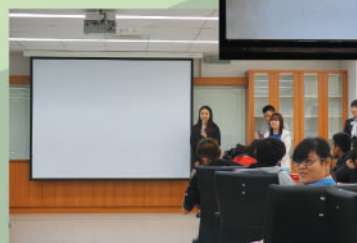
本校舊生在靜宜大學就讀食品及營養學系