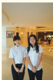
同學在香港旺角朗豪酒店大堂留影

暑假期間，我們安排了四名學生分別在香港旺角朗豪酒店、漢瑞祥有限公司及Sunny Garden Smart Kids Centre 進行工作實習。