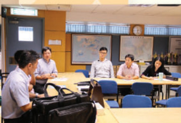
本組老師與大學代表亦有交流的機會