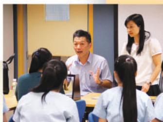
大學代表與學生們暢談 台灣升學概況