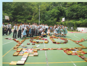
最具創意獎 高中組 6D班