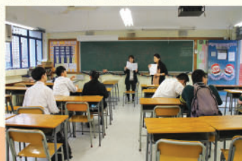
專業社工向學生講解模擬面試的流程