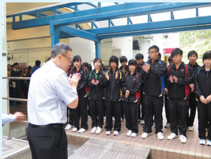
新一屆學生會宣誓

經過全體學生投票後，本年度當選的學生會內閣為1號Phoenix。Phoenix於未來一年除為同學爭取福利外，也會代表全體同學，作為橋樑，跟校方磋商不同的議題。