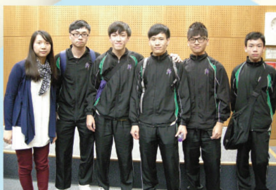
香港朗誦節英文戲劇亞軍