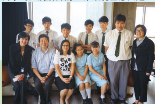
師生與九龍倉集團職員合照

本組與企業、會計與財務概論科合辦參觀連卡佛總部活動，在參觀過程中同學能深入了解公司的發展歷史及企業架構，對高級零售業務亦有初步認識。同學還可到總部內各個部門參觀，總部內各工作區域採用空間開放式設計方案，到處放滿植物及藝術品，同時還有瑜伽館、冥思房、午睡休息室和遊戲室等，同學對充滿活力的工作環境甚感興趣。