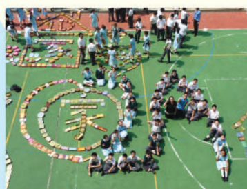
最具創意獎 初中組 2A班