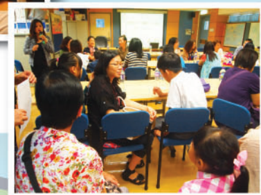
家長分組分享經驗