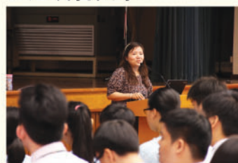
香港浸會大學代表講解入學要求