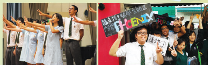
候選內閣於周會上進行宣傳活動