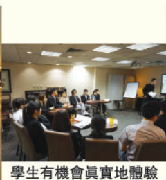
學生有機會真實地體驗酒店為新招聘員工而設的培訓工作坊