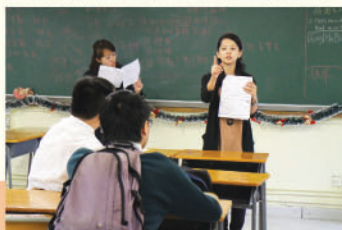
馬姑娘向學生講解面試技巧

本組於3/11 及1/12 安排了基督教香港信義會天恩培訓及發展中心專業社工為二十名中六級學生分別進行了小組面試工作坊及模擬面試活動。活動首先以小組形式進行，目的旨在提升學生的面試能力。之後，以個人形式，一位社工對一名學生進行面試，讓學生體驗真實的工作面試情境，提升個人面試技巧。