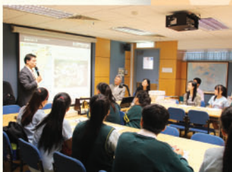
大學代表向學生介紹大學 各學系及收生要求