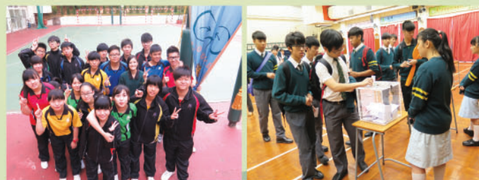
充滿活力的新一屆學生會 Phoenix