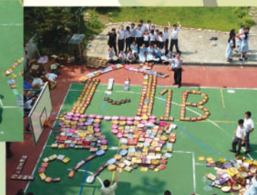
最積極參與獎 + 最具創意獎 初中組 1B班