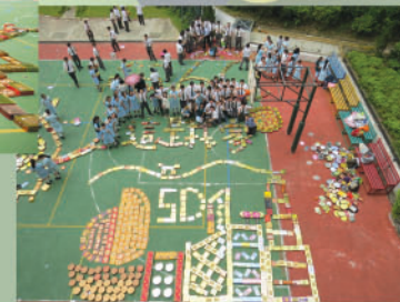
最積極參與獎 + 最具創意獎 高中組 5D班