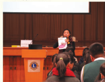
職業訓練局代表向學生介紹該院校不同類型的課程